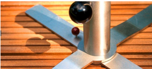
Detail des Sonnenschirmständers für leichte Schirme

Sonnenschirme sollen spätestens, wenn sie sich verformen, geschlossen werden.