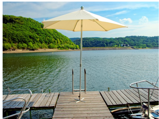
Sonnenschirmständer mit Fußkreuz (SLS-Z380M42)